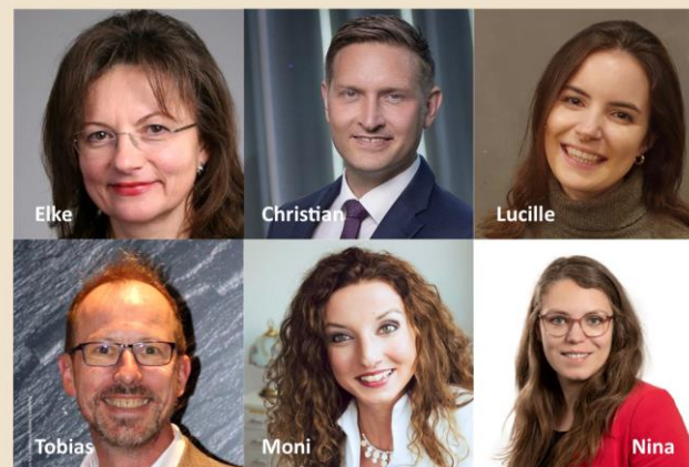
Das Kernteam des Zentrums

Für die Zukunftsfähigkeit Ihres Unternehmens: Sich selbst und Beschäftigte qualifizieren, Wettbewerbsfähigkeit stärken!